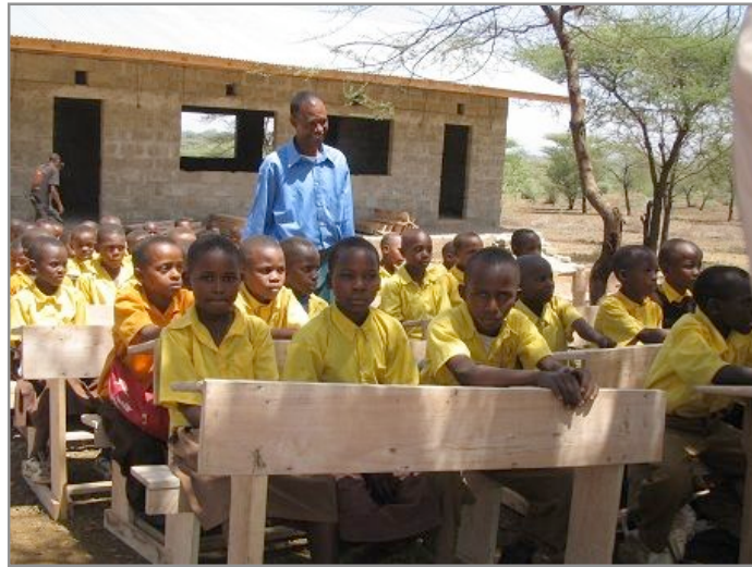
Les élèves inaugurent leurs nouveaux pupitres avant même qu'ils soient installés dans la classe !