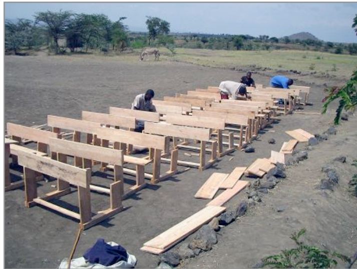
Les pupitres sont amenés et montés sur place